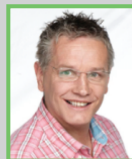
Torkild Sköld Personligt ledarskap - bli din egen bästa ledare genom medvetna val

Anmäl dig via din sponsor på www.kunskapsdagarna.nu – idag!